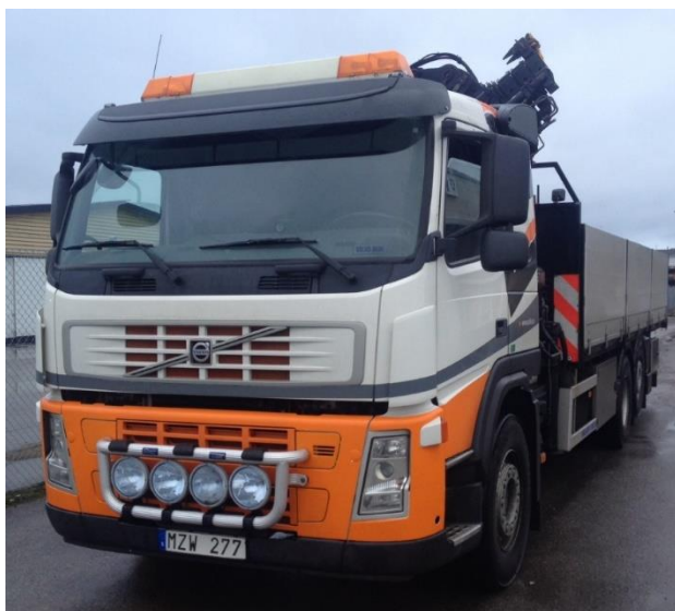
KB6, MZW 277 Volvo FM300, 2009