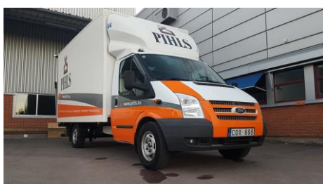
COX 666 Ford Transit med bakgavellyft, 2012

Max last 1035 kg. Ant. Pallplatser 6 Flaklängd 4 m