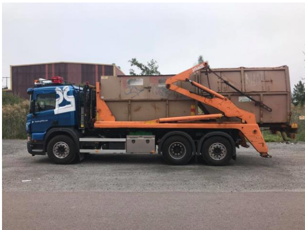
LV1, CZL 584 Scania P380, 2008