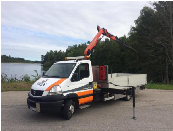
KB10, BRG 284 Renault Mascott, 2008