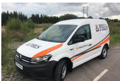
TBT 894 VW Caddy, 2018