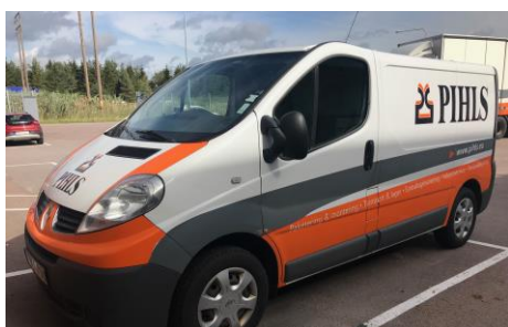
OBH 796 Renault Trafic, 2014