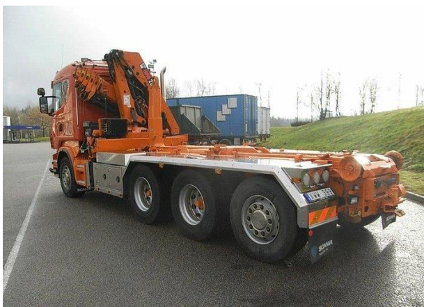
LV2, XWW 399 Scania R480, 2007