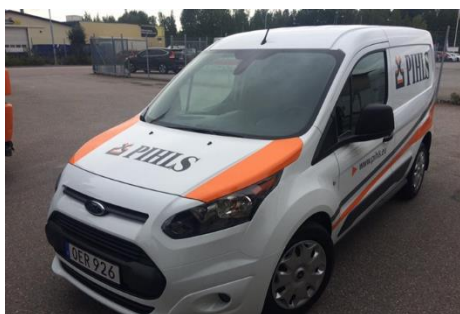
OER 926 Ford Connect, 2016