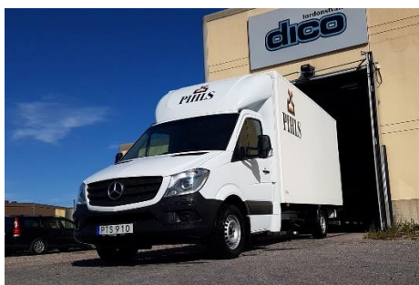
PTS 910 MB Sprinter med bakgavellyft, 2015

Max last 1035 kg. Ant. Pallplatser 6 Flaklängd 4 m