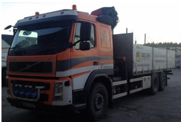
KB3, SYJ 647 Volvo FM9, 2007